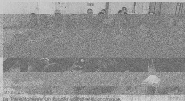
Le Transléonarde. Un succès sportif et économique.

Les objectifs de la Transléonarde sont d'ordre sportif, mais aussi tou-